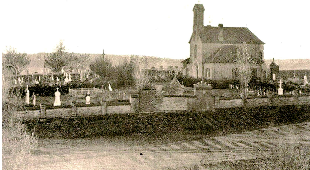
Der neue „Gottesacker“ von Gerzen wurde 1873 außerhalb der Hofmark angelegt – „und ein Leichenhaus in demselben errichtet“. Aufnahme von 1890.