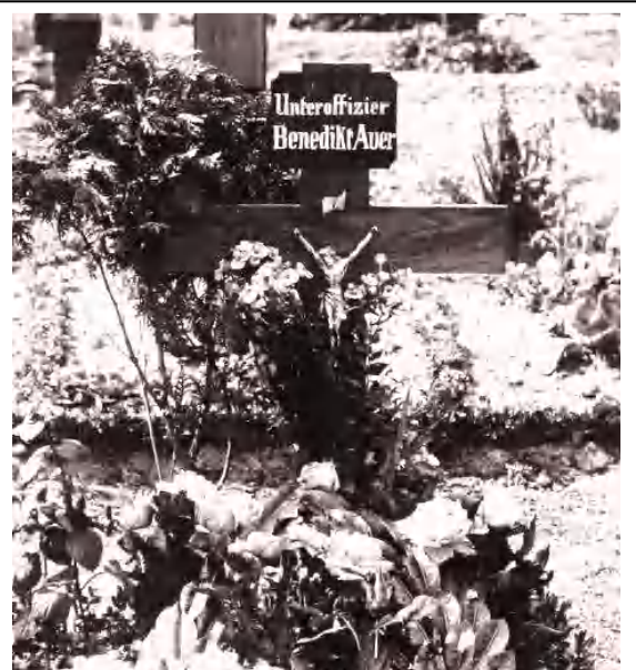
Grab von Benedikt Auer auf dem Soldatenfriedhof in Lome-Nordfrankreich