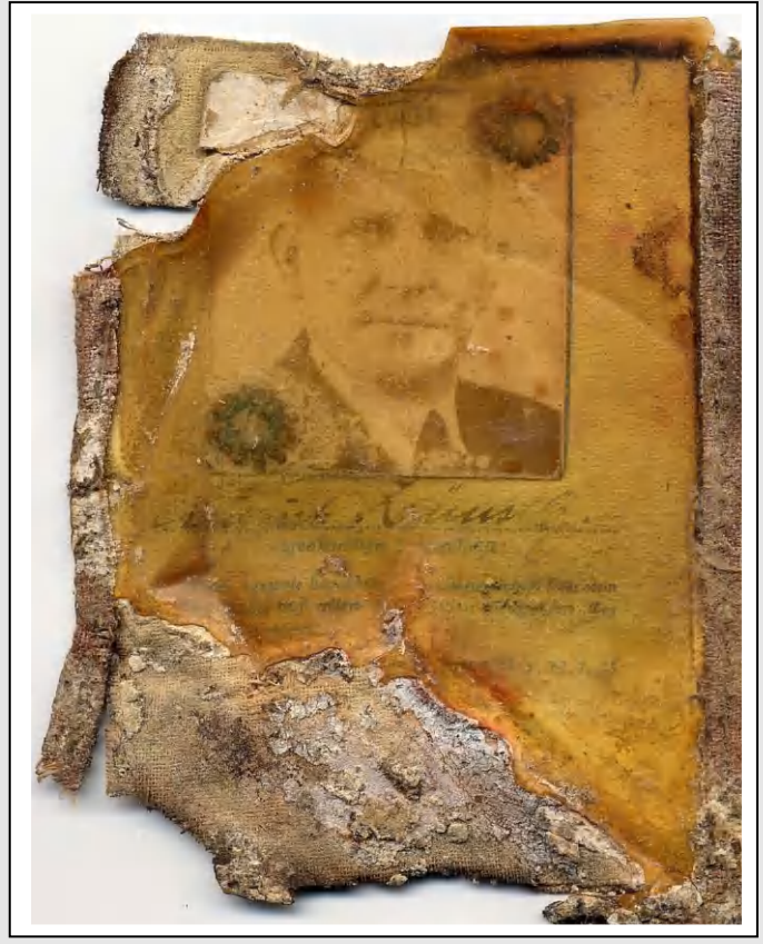
Der bei der Exhumierung am 28.01.1952 gefundene Ausweis des Flugkapitän, und damals einziges Indiz, dass es sich bei dem Absturz um die Condor Hessen handelte.