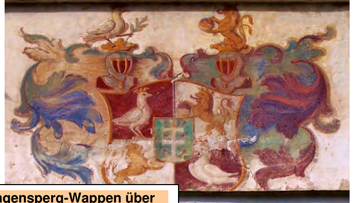
Chlingensberg-Wappen über dem Portal des Adelmans-Schlusses