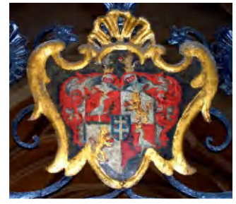
Chlingensberg-Wappen im Eisengitter der Pfarrkirche Hl. Blut.