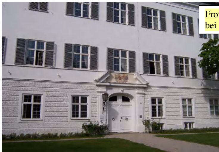
Frontseite des Adelmanschlusses auf Berg bei Landshut, Foto: P. Käser, 2014