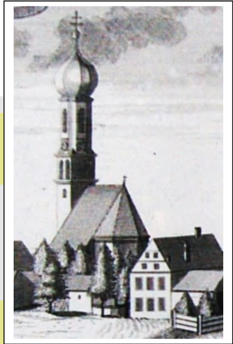
Kirche Seyboldsdorf. Michael Wening Ca. 1710

Beim Betrachten des originellen Fotos des Jahres 1903 kann nur gefolgert werden: Sicherheitsvorschriften am Bau waren noch nicht bekannt. In luftiger Höhe werden hier Abbruchhämmer geschwungen, ein schmales Brett dient als Übergang und verbindet das Kirchenlanghaus mit dem Abbruchwerk. Bemerkenswert ist, dass die meisten Bauarbeiter weiße Schmutzschürzen tragen.