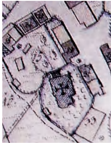
Katasterkarte aus dem Jahr 1848 unten Mitte: Kirche mit Friedhof

Eine Erweiterung der Pfarrkirche Seyboldsdorf erschien zu Beginn des 20. Jahrhunderts als ein dringendes Bedürfnis. Vier Altäre waren in der kleinen Kirche, die Kanzel stand an der linken Wand im Kirchenschiff. Die gräfliche Herrschaft ging durch die ehemalige Sakristei zu ihren Plätzen – den beiden Chorstühlen im Presbyterium.