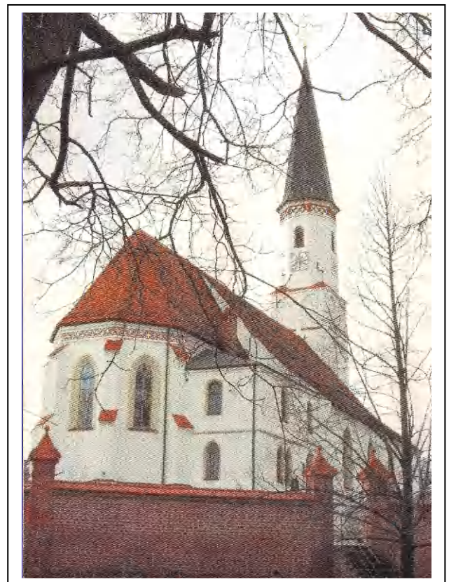
Kirchenführer: Die Kirchen der Pfarrei Seyboldsdorf. Peter Käser, 2004