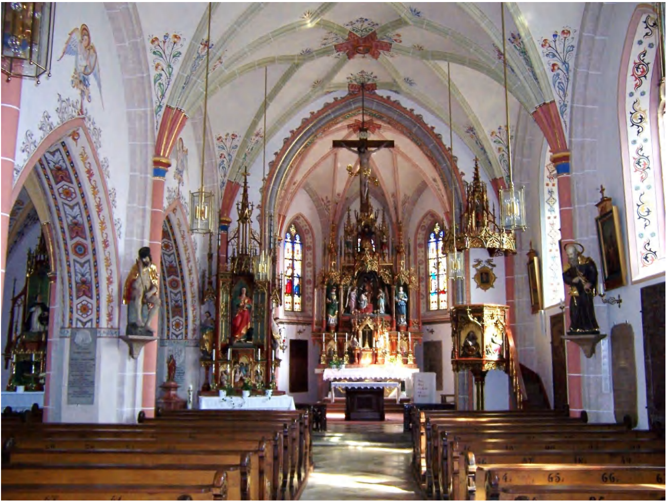
Als ein herrlicher sehenswerter Kirchenbau präsentiert sich die Pfarrkirche Sankt Johannes in Seyboldsdorf.