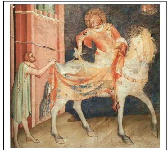
Simone Martini: Martin teilt seinen Mantel, um 1321, Fresco in der Unterkirche der Basilika die San Francesco in Assisi.

Sankt Martin wird auch mit einer Gans dargestellt.