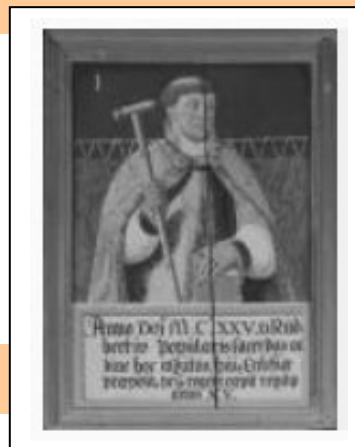
Bild 1 einer Äbtereihe, Tafelbild, um 1589, Windberg, Prämonstratenserkloster, Pfarrhof/ehem. Prälatur. Copyright: Haus der Bayerischen Geschichte, Augsburg (Voithenberg, G.) Wikipewdia, Windberg