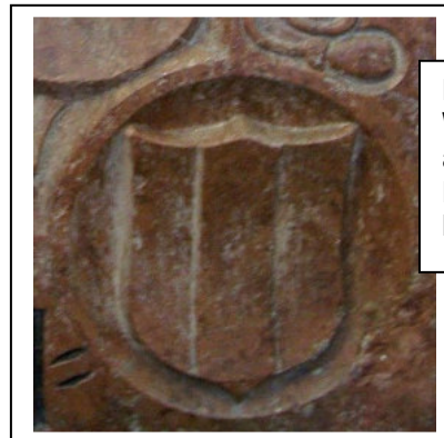
Das Fraunberger Wappen, auf dem Grabmal des Bernhard von Seyboltstorff - rechts unten.

Die Linie Fraunberg zu Fraunberg erhielt nach dem Erlöschen der Linie Fraunberg zu Haag von Kaiser Maximilian II. im Jahr 1570 die Genehmigung zur Vermehrung ihres Wappens mit dem der ausgestorbenen Grafen von Haag.